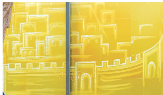
新耶路撒冷彩繪玻璃