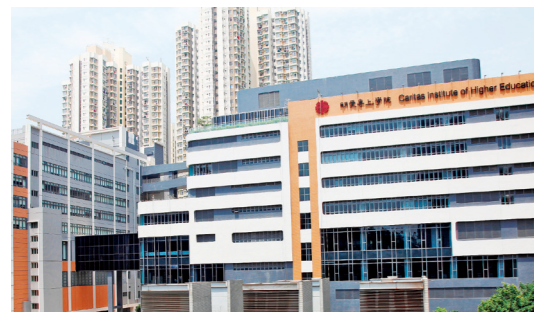
明愛專上學院新校舍