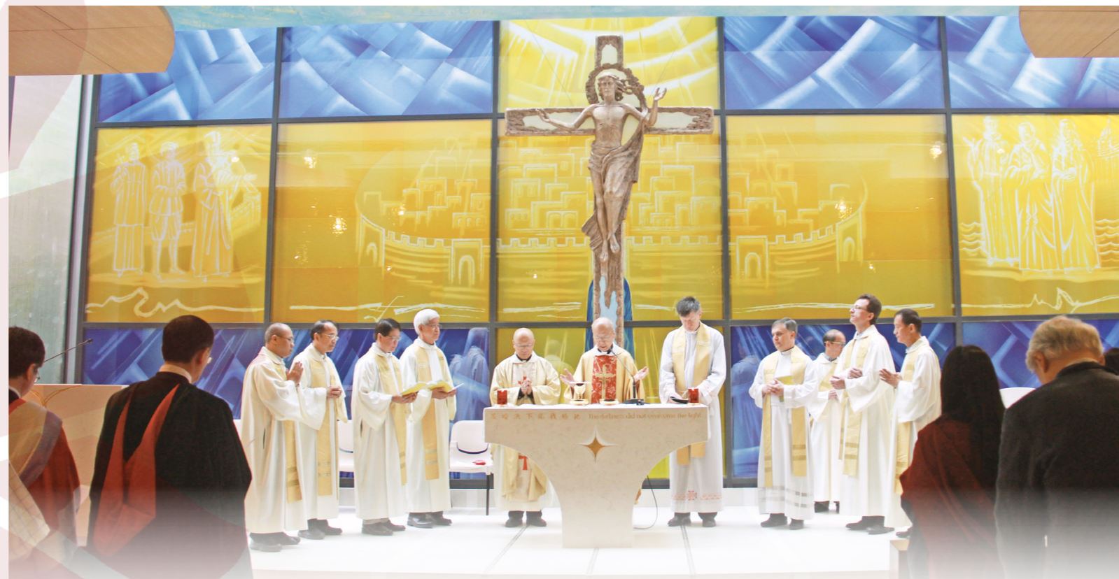
湯漢樞機七月八日主持新校舍聖堂祝福禮

聖堂內外均帶出三位主保的風格。郭志德說，校舍大門彩繪玻璃透射陽光，融和自然和校內環境，象徵聖方濟對大自然和遭遇困難的人的關懷；聖堂外馬賽克壁畫兩艘船於大海上行駛，記述聖方濟各沙勿略到日本及中國（卒於上川島）傳教，帶出福傳精神；同層的演講廳外的簡約馬賽克壁畫，圓心輻射到聖言萬語，代表聖方濟沙雷氏傳播的學問與信仰。另外，聖堂外有寧靜的緩衝公共空間，可供小團體作祈禱活動。(鄧)