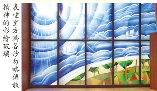
表達聖方濟各沙勿略傳教精神的彩繪玻璃