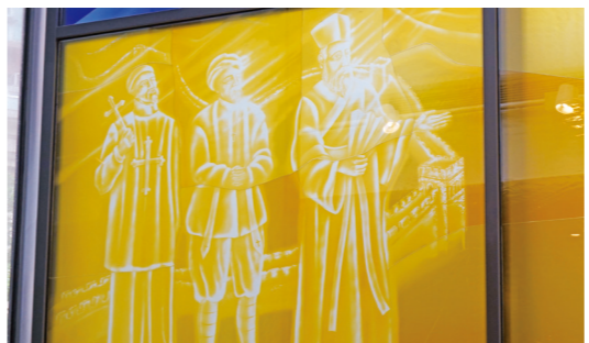
來華傳教士彩繪玻璃