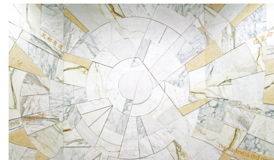
表達聖方濟各沙雷氏教誨信眾的馬賽克